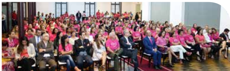
Abertura oficial do Outubro Rosa no Palácio Anchieta

detecção precoce do câncer de mama. Palestras são realizadas por profissionais da área oncológica, as fachadas dos monumentos históricos, dos imóveis públicos e privados ficam iluminadas na cor rosa, e empresas fazem doações em espécie e em produtos para os pacientes.