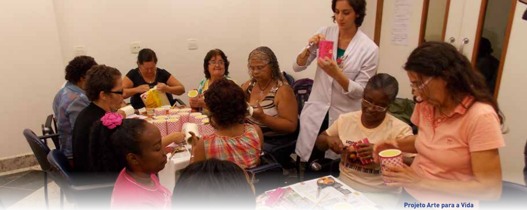
Projeto Arte para a Vida